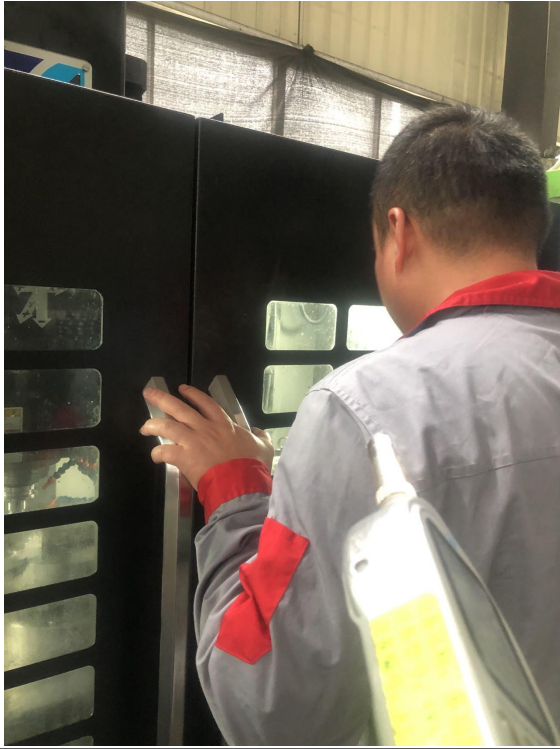
车间 2 加工中心岗位