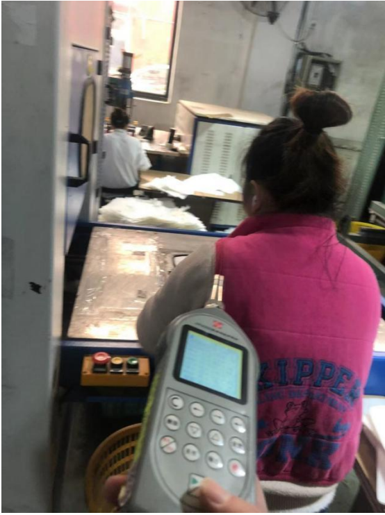
布囊车间冲裁岗位