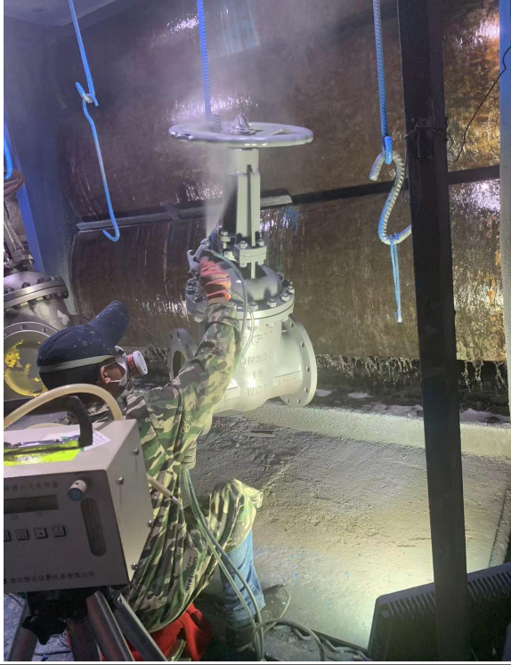
二期 1 车间喷漆岗位