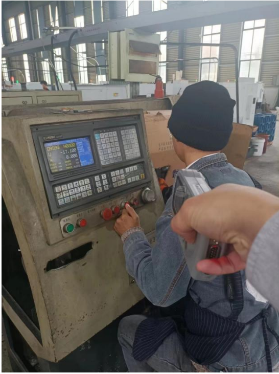
生产车间数控岗位 1