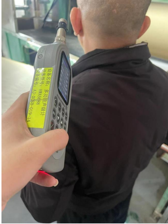
生产车间压花岗岩位