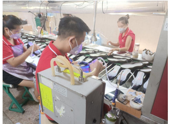
1号楼 4F 车间刷处理剂岗位