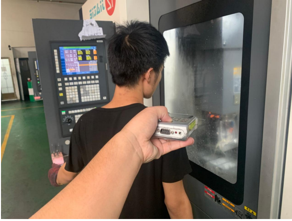
生产车间数控岗位