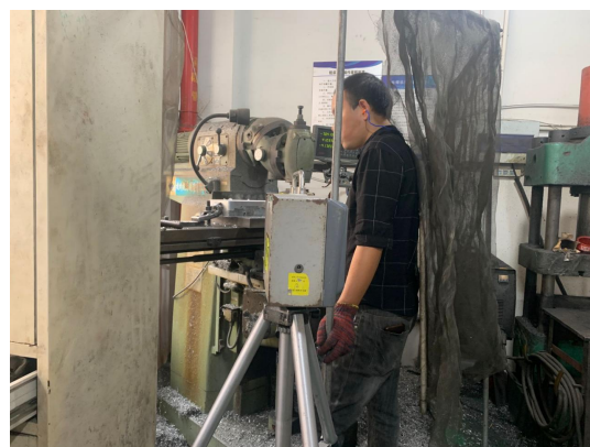
生产车间打磨岗位