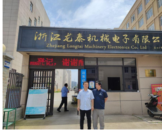
浙江龙泰机械电子有限公司